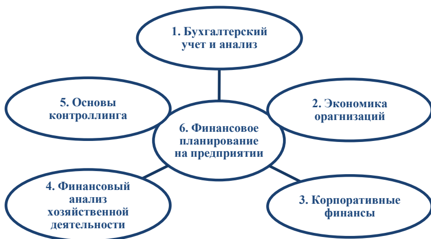
Рис. 2. Логика изучения экономических дисциплин

ду кафедрой разработчиком и заказчиком позволяет устранить неэффективное дублирование тем и вопросов и перейти к реальному заказу.